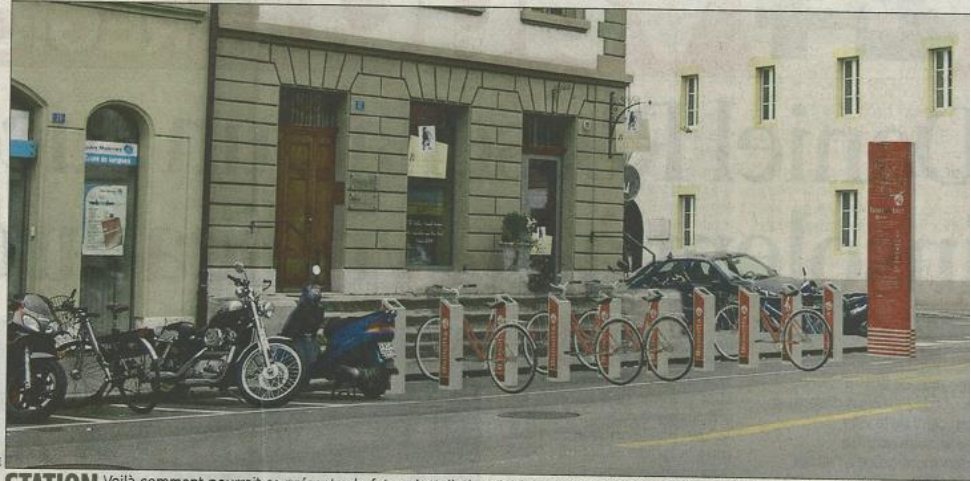
STATION Voilà comment pourrait se présenter la future installation (ici à la rue Louis-de-Savoie). Les commerçants ont été consultés, et, rassure la municipale, «aucune place de stationnement de véhicules n'a été supprimée».

L'EPFL et l'Unil devraient également emboîter le pas avec l'implantation de quatre stations. Cela ne s'arrête pas là: «Yverdon a lancé un appel d'offres auquel nous avons répondu. Vevey envisage également d'adopter le système, et Aigle a pris contact avec nous, car les autorités sont en pleine ré-