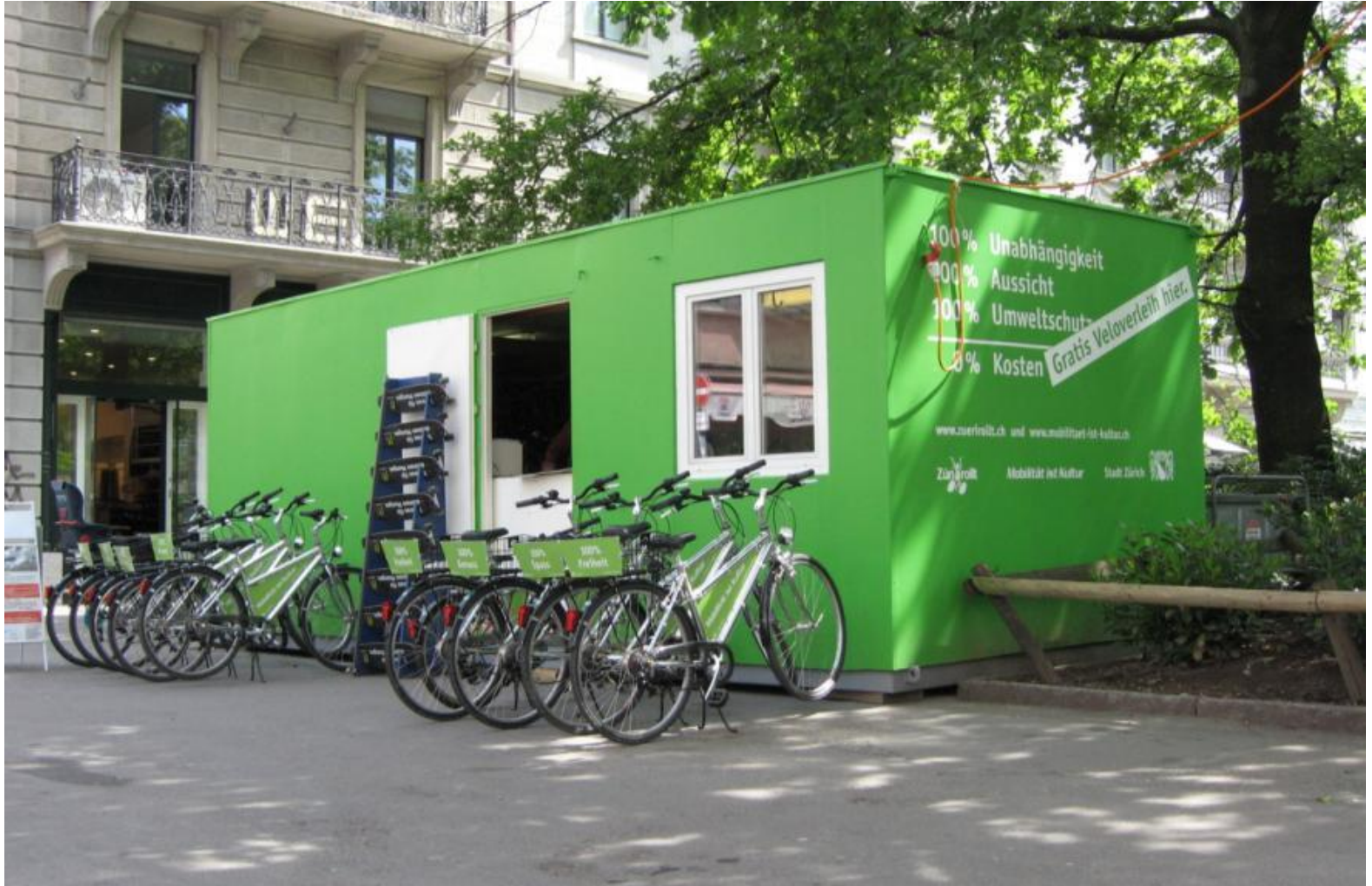
Bike Sharing Zurich Federal Roads Office FEDRO