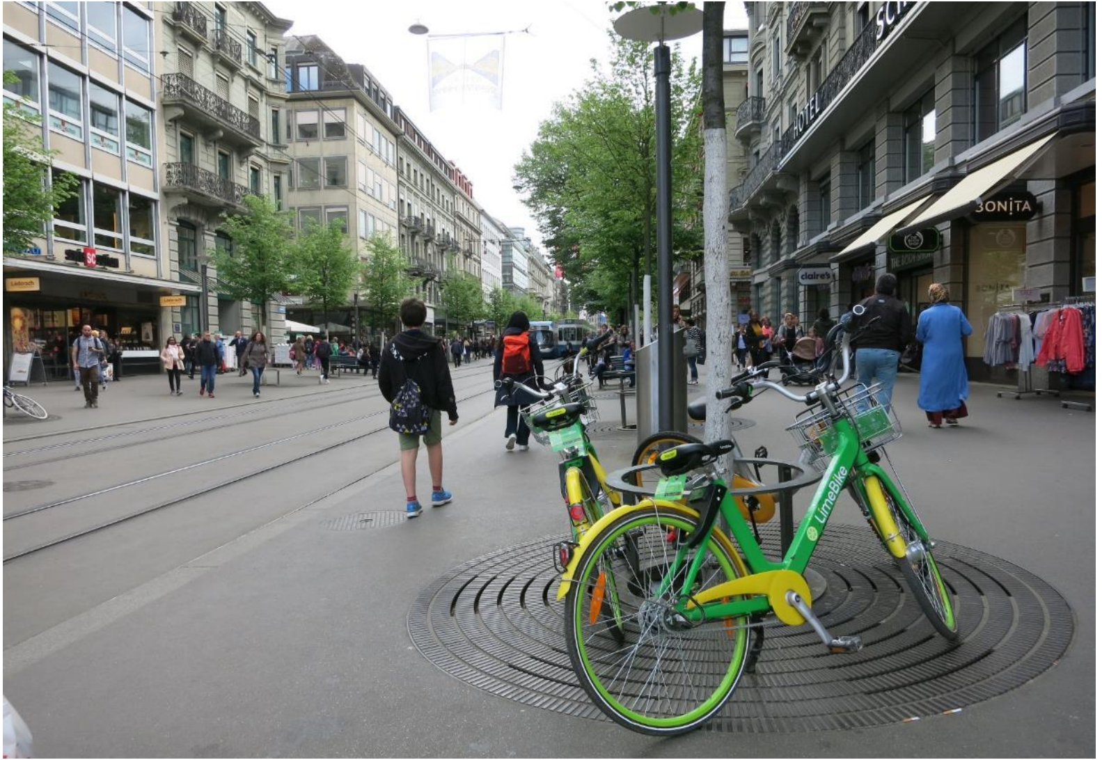
Bike Sharing Zurich Federal Roads Office FEDRO