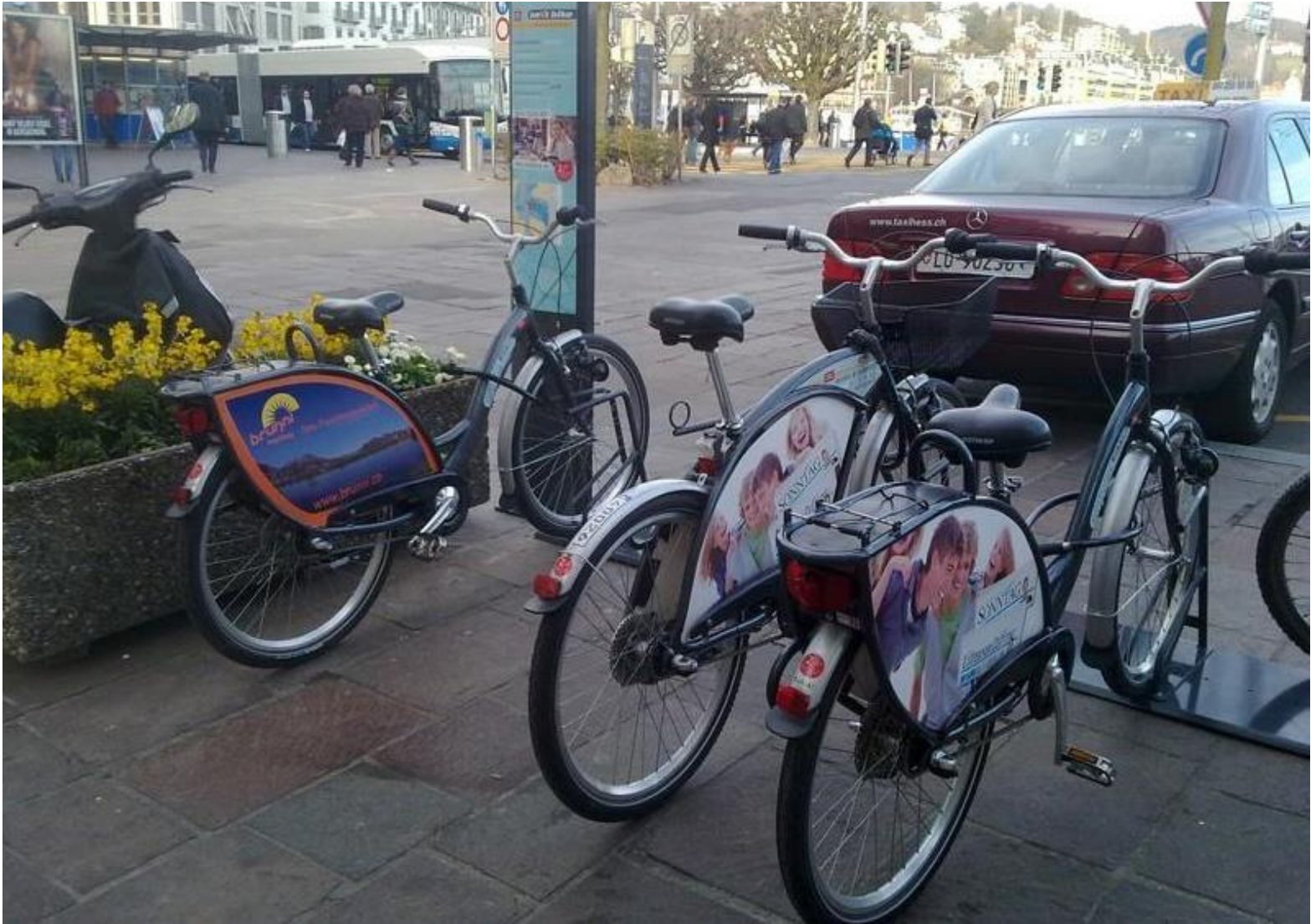
Bike Sharing Zurich Federal Roads Office FEDRO