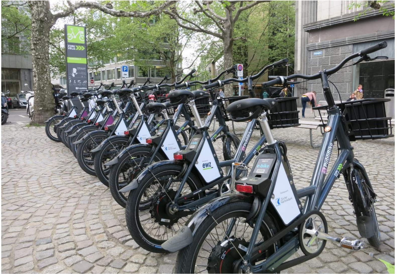
Bike Sharing Zurich Federal Roads Office FEDRO